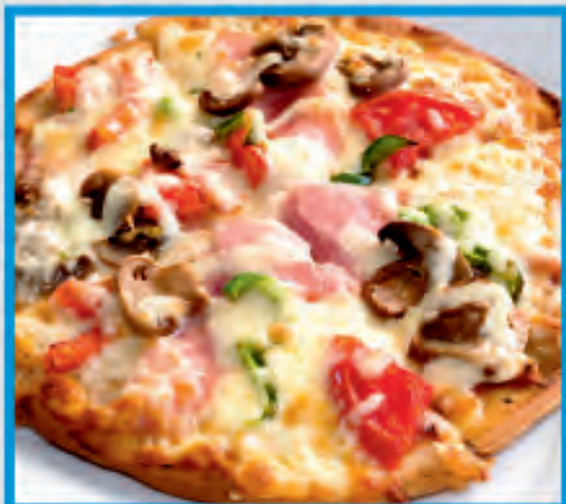
Small Pizza Πίτσα μικρή