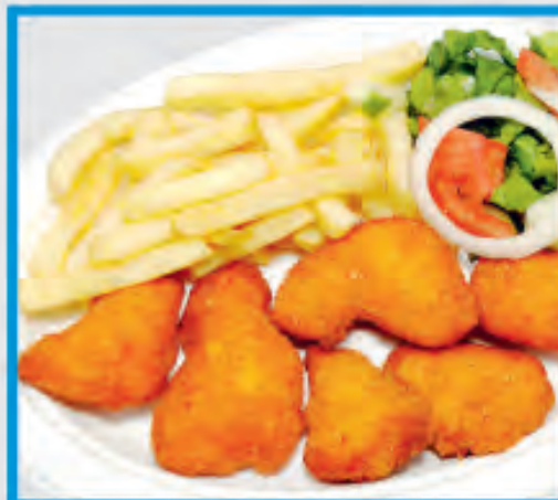
Chicken Nuggets Κοτόπουλο Νάγκες