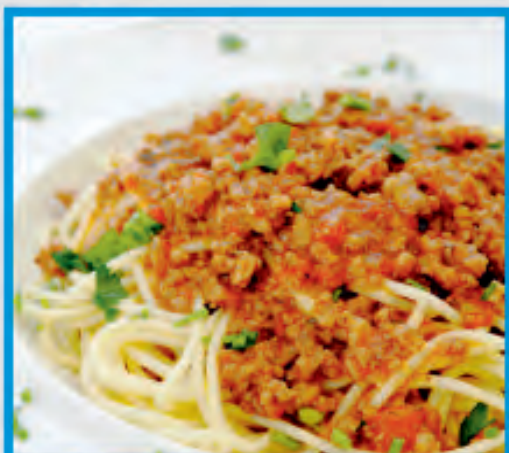
Spaghetti Plain, Neapolitan, Bolognaise or Carbonara Σπαγγέτι Νηπολιτέν, Μπολωνέζ ή Καρμνονάρο