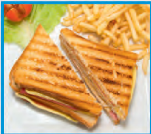
Cheese & Ham Toast Τοστ Ζαμπόν Τυρί